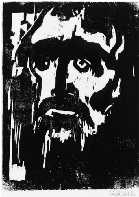
Figura 4 - O Profeta

Fonte: NOLDE, Emil. O Profeta . 1912. Xilogravura. Museu de Arte Moderna de Nova York.