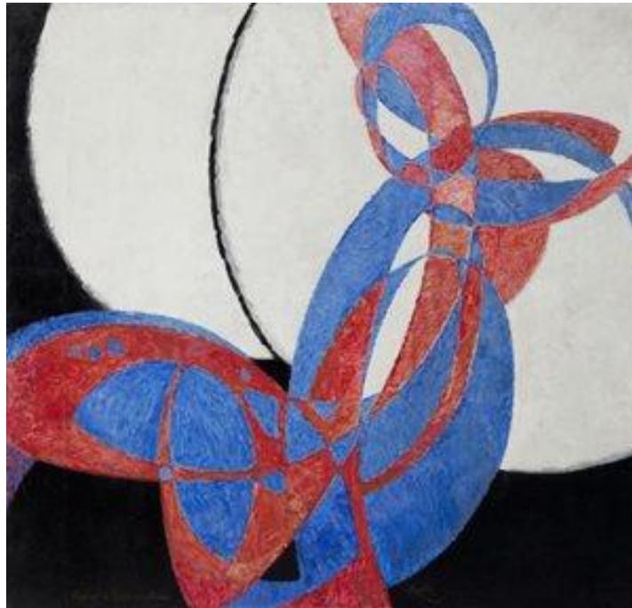
Figura 8 - Amorfa de Cores

Fonte: KUPKA, Frantisek. Amorfa de Cores . 1912. Óleo sobre tela.