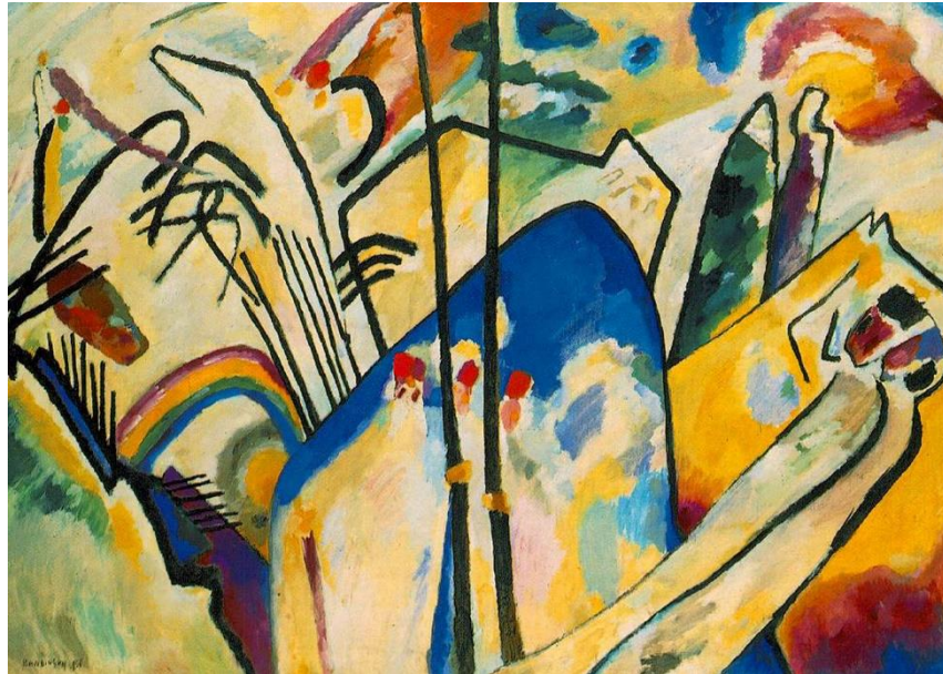
Figura 6 - Esboço para a Composição IV (Batalha)

Fonte: KANDINSKY, Wassily. Esboço para a Composição IV (Batalha) . 1911. Óleo sobre tela.