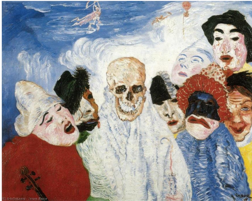
Fonte: ENSOR, James. A Morte e As Máscaras . 1897. Óleo sobre a tela.

Medindo 78,5x100 cm, o óleo sobre a tela de James Ensor traz a morte, representada na forma de caveira, cercada por sete máscaras, as quais trazem diferentes expressões. Essas máscaras e caveira estão envoltas por um céu azulado e com nuvens, sendo possível perceber ao fundo três imagens pequenas: à esquerda parece ser um esqueleto completo, segurando um arco e parecendo vestir uma capa esvoaçante; no meio, outro esqueleto voando e que parece segurar o que seria um cajado (podendo remeter ao cajado da morte); e mais à direita um balão voando com uma corda ou corrente pendurada. Essa tela mescla elementos medievais e modernos, intercalando o que seria um sonho, algo irreal, com rostos e máscaras, que poderiam ser reais.