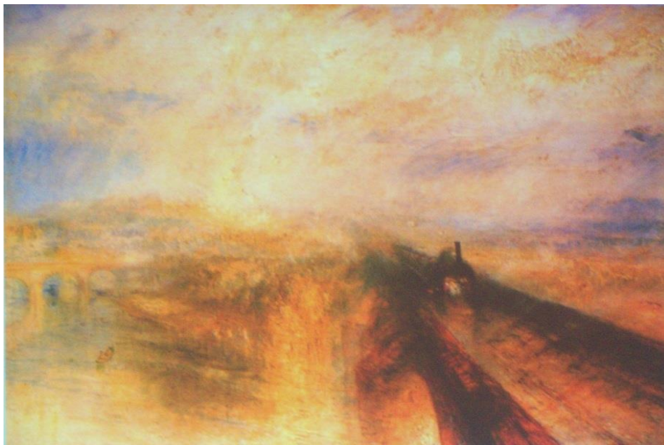
Figura 7 - Chuva, vapor e velocidade

Fonte: TURNER, J. M. William. Chuva, vapor e velocidade . Tinta a óleo. 1844. Galeria Nacional de Londres.