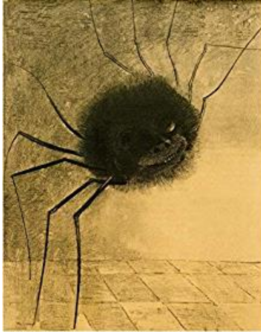
Figura 1 - A Aranha Sorridente

Fonte: REDON, Odilon. A Aranha Sorridente . Litografia. 1887. Museu Britânico.