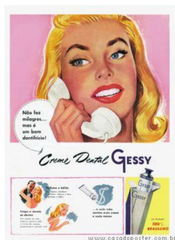
Figura 10: Anúncio Gessy