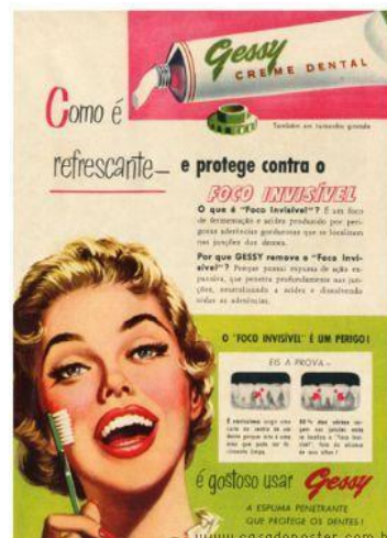
Figura 17: Anúncio Gessy

O produto era caracterizado pelo seu novo sabor refrescante, tendo como destaque nas imagens uma referência implícita ao frescor pela presença do gelo (nos tons de azul e branco): um cubo grande funcionando como uma hipérbole visual. A hipérbole também se nota no texto quando destacava “Refrescante ‘de tinir!’” e atestava que o frescor da nova pasta causaria prazer e satisfação. Somavam-se depoimentos de pequenas figuras que salientavam as propriedades do produto: “a maneira mais gostosa de dar bom dia a sua boca”.