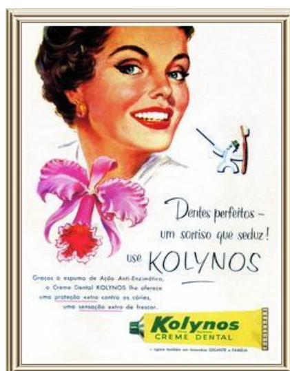
Figura 15: Anúncio Kolynos

O desejo pelo bom hálito não era novidade, o diferencial estava no discurso veiculado nos anúncios acerca da possibilidade de produtos disponíveis para eliminar os odores incômodos, produzindo sensação de bem-estar e, além disso, prometendo trazer felicidade, amor e realização. Da mesma forma, esses desejos subjetivados pelas mulheres eram resumidos em outros anúncios, como na mensagem: “Dentes perfeitos – um sorriso que seduz! Use Kolynos”. 31