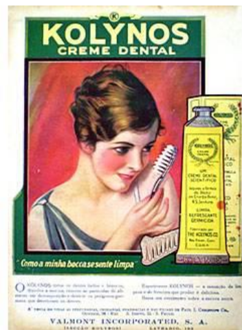
Figura 9: Anúncio Kolynos

Apesar de prevenirem o consumidor de possíveis frustrações com o slogan – “Não faz milagres... mas é um bom dentífrico!”, os anúncios reiteravam imagens de belas mulheres, com realce para o rosto e colo –, mostravam trajas elegantes, adereços e joias, cabelos impecavelmente arrumados, olhar alegre e até sensual (como o das atrizes de cinema e modelos). Entretanto, o destaque maior era para o sorriso radiante com dentes brancos e perfeitos, contornados por lábios delineados. Para completar, o conselho “Use sempre seu sorriso número um” (envolto num coração no anúncio à direita). Realçavam-se as vantagens do produto: “Limpa e protege os dentes. Refresca e perfuma o hálito”.