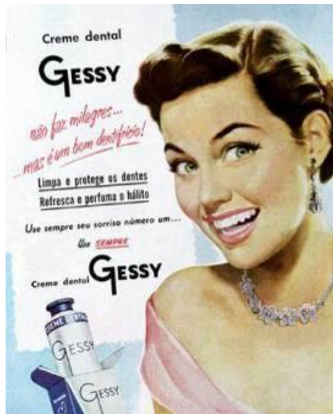
Figura 7: Anúncio Gessy