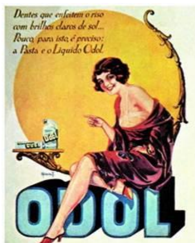
Figura 3: Anúncio Odol.

O anúncio de Odol apresentava uma figura feminina de corpo inteiro, esguia, elegante e moderna (na postura e nos cabelos curtos). A associação entre esses qualificativos e o produto era destacada nos dizeres “Dentes como um fio de pérolas”, elegância e sensualidade eram atreladas aos dentes claros e ao uso da pasta e do dentifrício, que transformaria os dentes em um fio de pérola 14 .