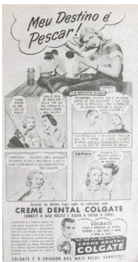
Figura 13: Anúncio Colgate 28