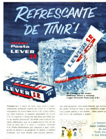
Figura 16: Anúncio Lever S. R.

mantendo uma forte influência do discurso odontológico. Nesse processo, passaram a priorizar também questões estéticas (brancura e beleza dos dentes) e a proteção aos dentes e gengivas. Além desses, outro aspecto que se fez gradativamente presente foi a sensação de prazer em escovar os dentes, associada ao sabor agradável e frescor do hálito.