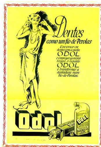
Figura 2: Anúncio Odol, 1929.