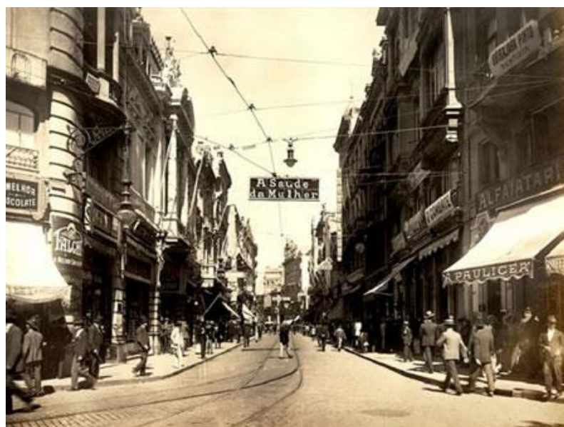
Figura 1: Centro de São Paulo

Nesse quadro de transformações urbanas e comerciais, destacava-se a expansão da circulação de periódicos, jornais diários e revistas para públicos variados, que veiculavam um número cada vez maior e diversificado de anúncios de produtos, os quais também apareciam numa multiplicidade de cartazes espalhados pela cidade, nos bondes, nas farmácias, nos muros, nas avenidas, no teto dos edifícios, entre outros locais.