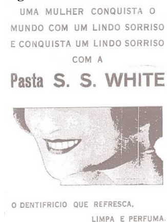
Figura 4: Anúncio S. S. White