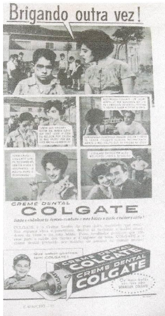
Figura 14: Anúncio Colgate 30

Fonte: CAPRICHOS. São Paulo, p. 37, 1960.