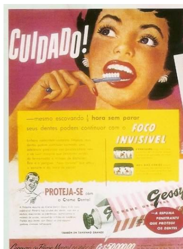
Figura 5: Anúncio Gessy