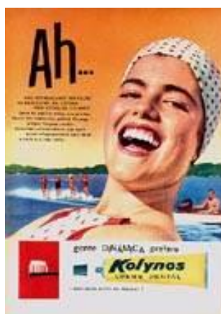
Figura 18: Anúncio Gessy

A publicidade, além da veiculação dos produtos, buscava transformar hábitos de higiene, instituindo desejos como combater o “cheiro de corpo (CC)” e o mau hálito, gerando a aspiração prazerosa do hálito refrescante. Nesse sentido, perante qualquer dificuldade, apresentava como solução um produto através do qual se poderia obter o prazer do frescor bucal; e atrelado a ele viria a felicidade, sucesso amoroso, social e profissional. 32