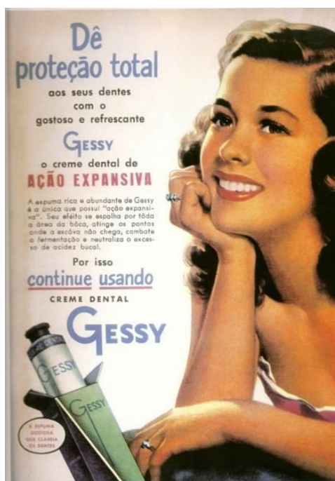
Figura 6: Anúncio Gessy

Por isso continue usando creme dental Gessy. 18