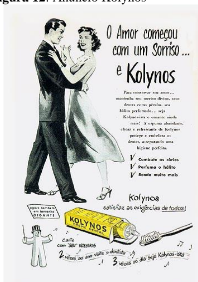
Figura 12: Anúncio Kolynos