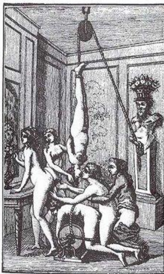
Ilustração 3 – Gravura de uma versão holandesa de Juliette

E como personagens libertinos têm-se os membros da nobreza e do clero, como uma forma de degradar os poderes vigentes. Para Bataille, ao ser “excluído da humanidade, Sade só teve na sua longa vida uma ocupação, que decididamente o prendeu: a de enumerar até a exaustão as possibilidades de destruir seres humanos, de os destruir e de gozar com o pensamento da sua morte e do seu sofrimento.” (BATAILLE. In . FERRAZ, Ano I. nº 12, p. 36). Assim, realizar sua vingança tornou-se meio de sobrevivência na prisão e manicômio. Realização esta pensada e vivida na ficção, mas que de fato transparecia o sistema prisional do período. Sua concepção de vingança da humanidade passou pela ordem, pelo método e pelo suplício, sistema de punição vivenciado nas prisões do século XVIII. Portanto torna-se importante analisar o paralelo entre a realidade prisional e a obra de Sade e, ao mesmo tempo, questionar o ufanismo dedicado ao autor pelos surrealistas e autores como Bataille e Octávio Paz, que perpetuaram o mito em torno desse autor.