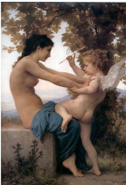
Ilustração 2 – Jovem se defendendo de Eros

ordem é apresentado pelo escritor, mas ansiado pelo leitor, que busca nesses relatos eróticos um meio de alcançar o prazer sexual. Portanto, alguns livros que se apresentam como exóticos ou transgressores, que possuem uma aura de malícia, proibição e mistério em torno de si, ao revelarem-se como manuais controladores do desejo sexual, tornam-se instrumentos de ordenação da força avassaladora de Eros.