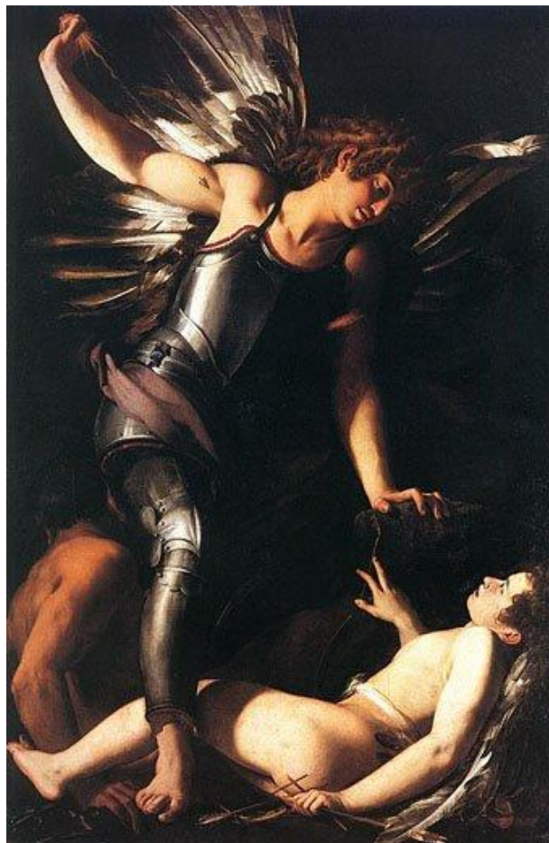
Ilustração 1 – Eros e Anteros

reflexão do erótico do indivíduo consigo mesmo e, nesse sentido, a “exuberância” pode ser a negação da vida, ou seja, a relação Eros e Tântatos.