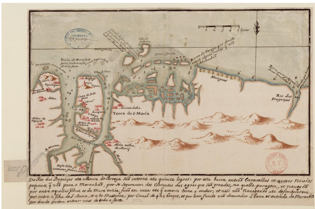
Mapa 1 – Do Rio das Preguiças até a barra do Perreya sao catorze ate quinze legoas... [por Joao Teyxeira]