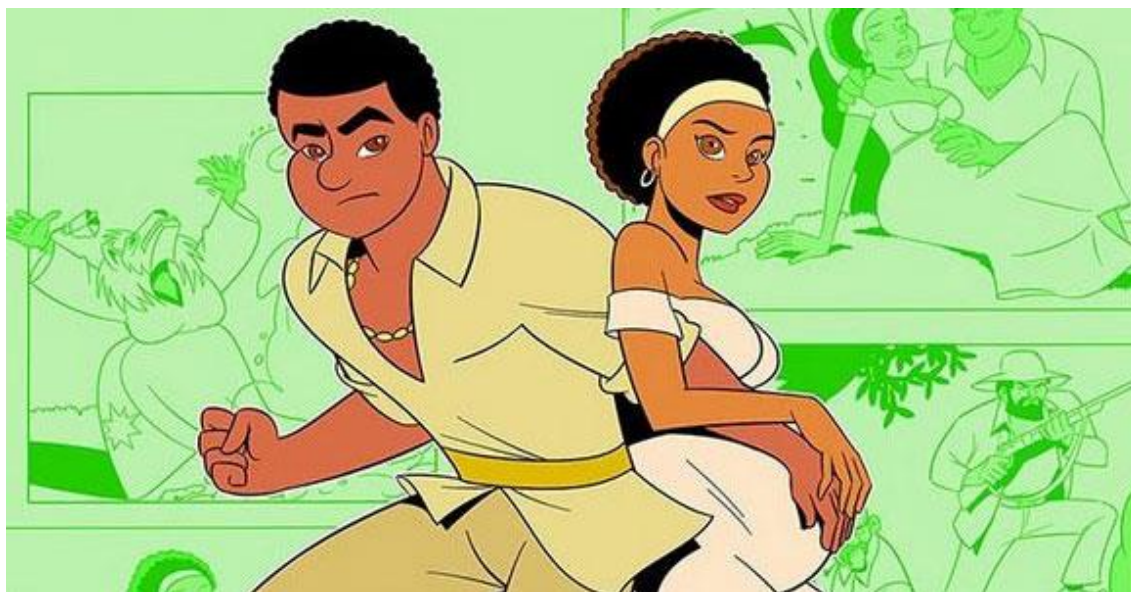
Figura 12 - Representação de Catirina e Pai Francisco no mangá 17