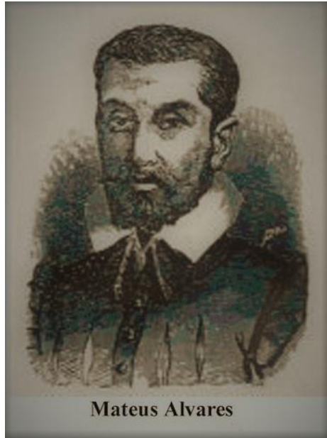
Figura 7- Gravura de Mateus Alvares