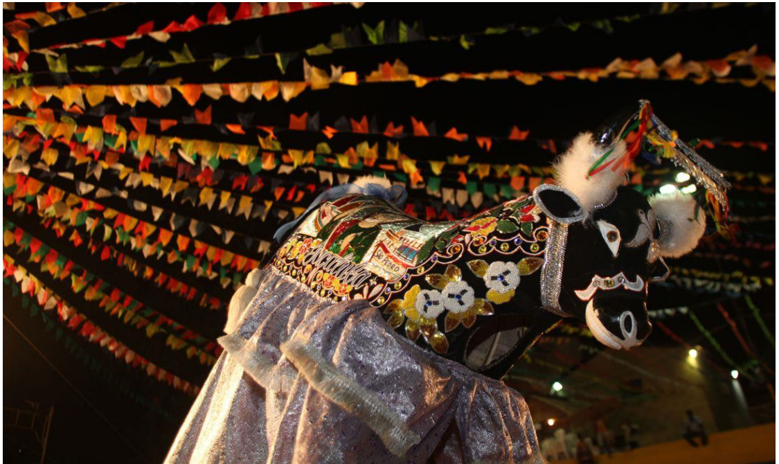
Figura 11 - Bumba-meu-Boi no Maranhão