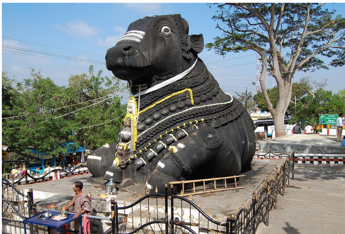
Figura 14 - Divindade Nandi em Mysore, Karnataka, na Índia

Entre os indianos, o touro também aparece como divindade. O deus védico Shiva possui um touro chamado Nandi, representando justiça e força, simbolizando o dharma , a ordem cósmica. Por fim, o touro está, ainda, associado à água, símbolo de fertilidade, e à lua, lembrando que existe a crença de que D. Sebastião aparece nos Lençóis justamente à noite, na época de lua cheia.