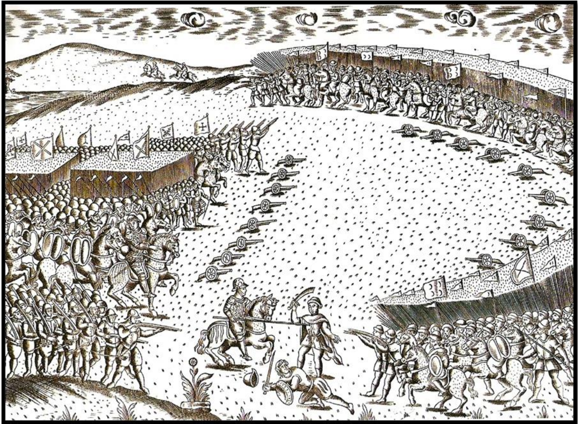
Figura 5 - Representação da Batalha de Alcácer-Quibir (1578), no Marrocos 8