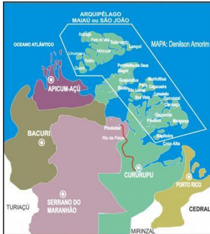
Figura 2 - Localização de Cururupu, no estado do Maranhão, Porto de Cujupe onde se localiza a Ilha dos Lençóis

cidade de Barreirinhas, localidade bastante frequentada em busca dos passeios nas dunas e no rio Preguiça.