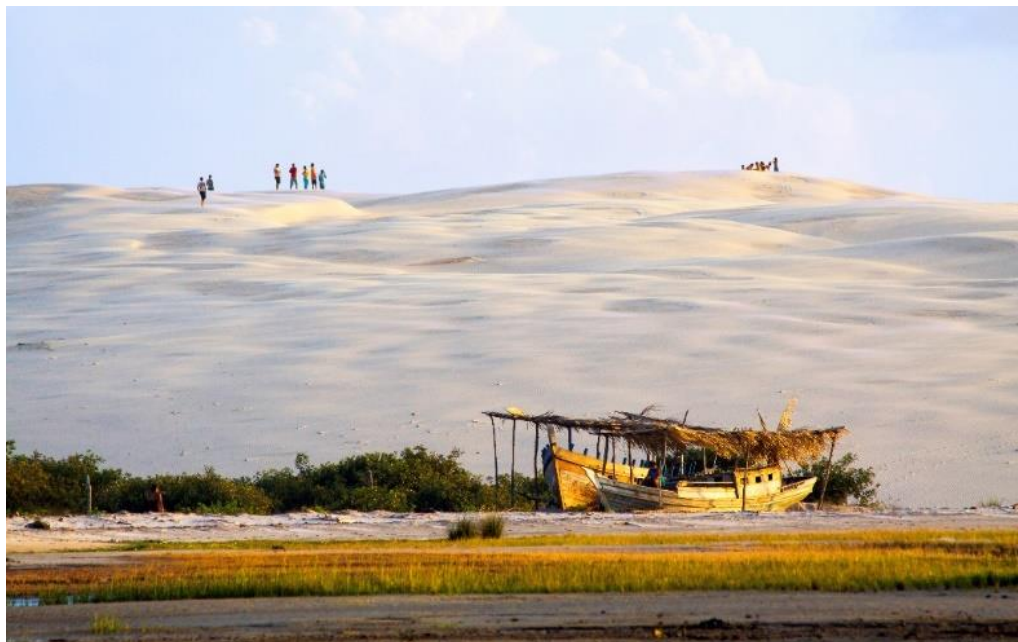
Figura 10 - Ilha dos Lençóis, Maranhão