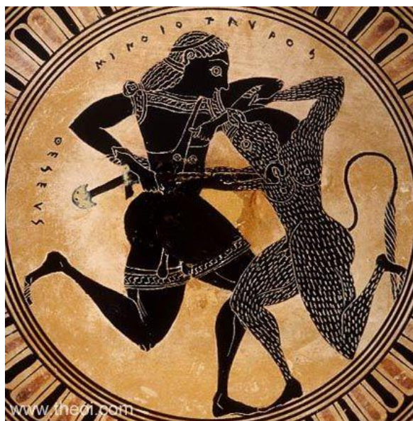
Figura 13 - Teseu matando o minotauro 19

O rei manda construir um labirinto para encerrar o monstro, a quem são entregues continuamente homens e mulheres de Atenas em sacrifício, até que o herói Teseu, auxiliado pelo fio de Ariadne, consegue ser vitorioso, matando o monstro. Vemos, na cena a seguir, pintada num vaso ático, o combate entre Teseu e o minotauro: