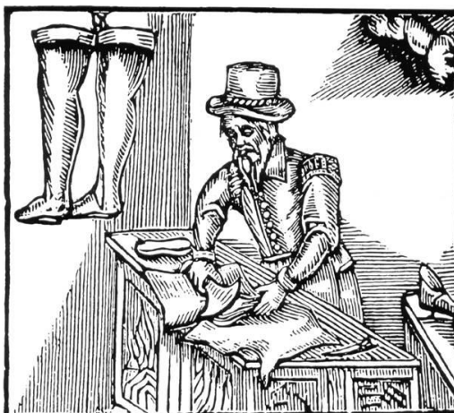
Figura 6 - Gravura representando Bandarra, sapateiro de Trancoso, em Portugal

Já o leão é experto [sic] Mui atento. Já acordou, anda caminho. Tirará cedo do ninho O porco, e é mui certo. Fugirá para o deserto, Do leão e seu bramido, Demonstra que vai ferido Desse bom Rei Encoberto (Bandarra, 2008, p. 57).