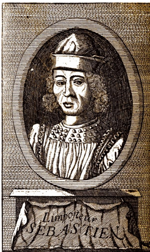
Figura 8 - Marco Tulio Catizone (Les Imposteurs Insignes, Jean-Baptiste de Rocolles, 1728)