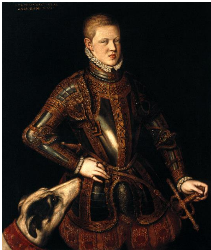
Figura 4 - D. Sebastião aos 17 anos, por Cristovão de Morais c. 1571-1574

Outros Tempos , vol. 21, n. 37, 2024, p. 112-139. ISSN: 1808-8031