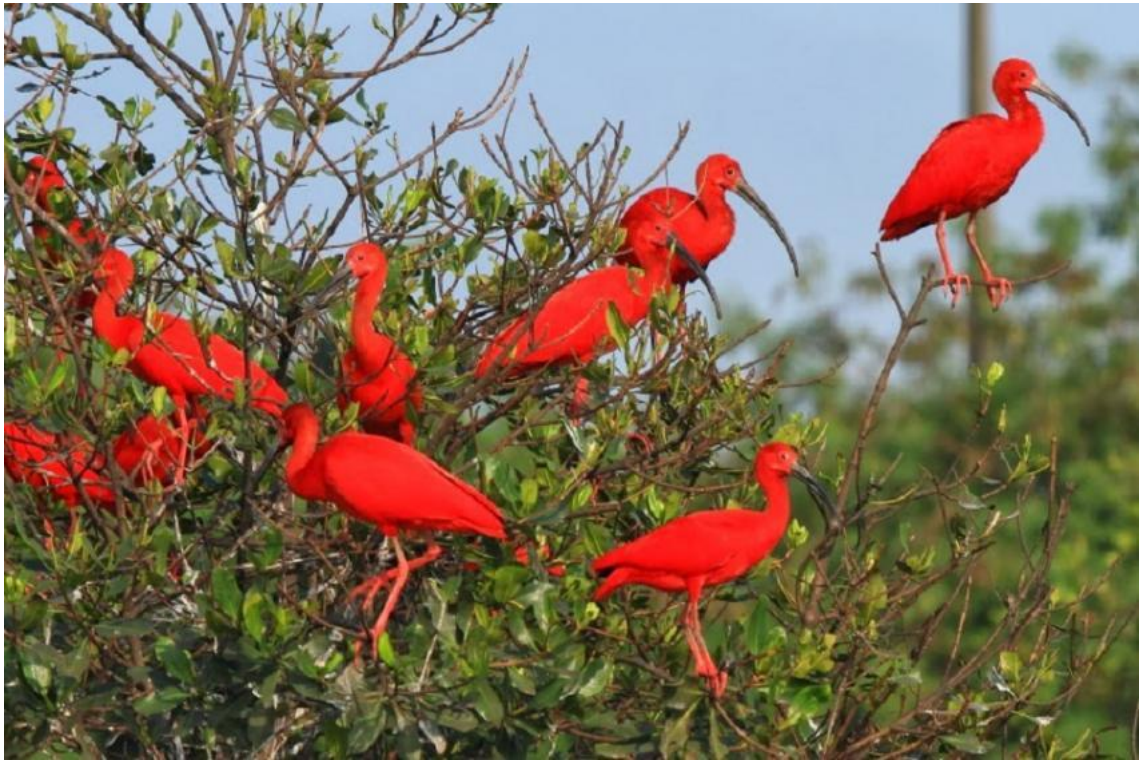
Figura 3 - Floresta dos Guarás (Apicum Açú-MA)