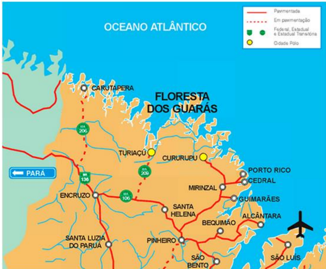
Figura 1- Mapa Floresta dos Guarás, no Maranhão, onde fica a Ilha dos Lençóis 4

por comunidades tradicionais quilombolas, e na região continental estão os pescadores artesanais.